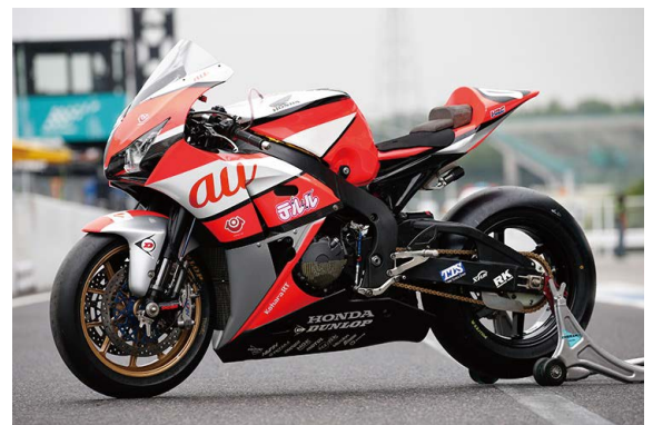
#090 MACHINE : Honda CBR1000RR T Y R E : DUNLOP